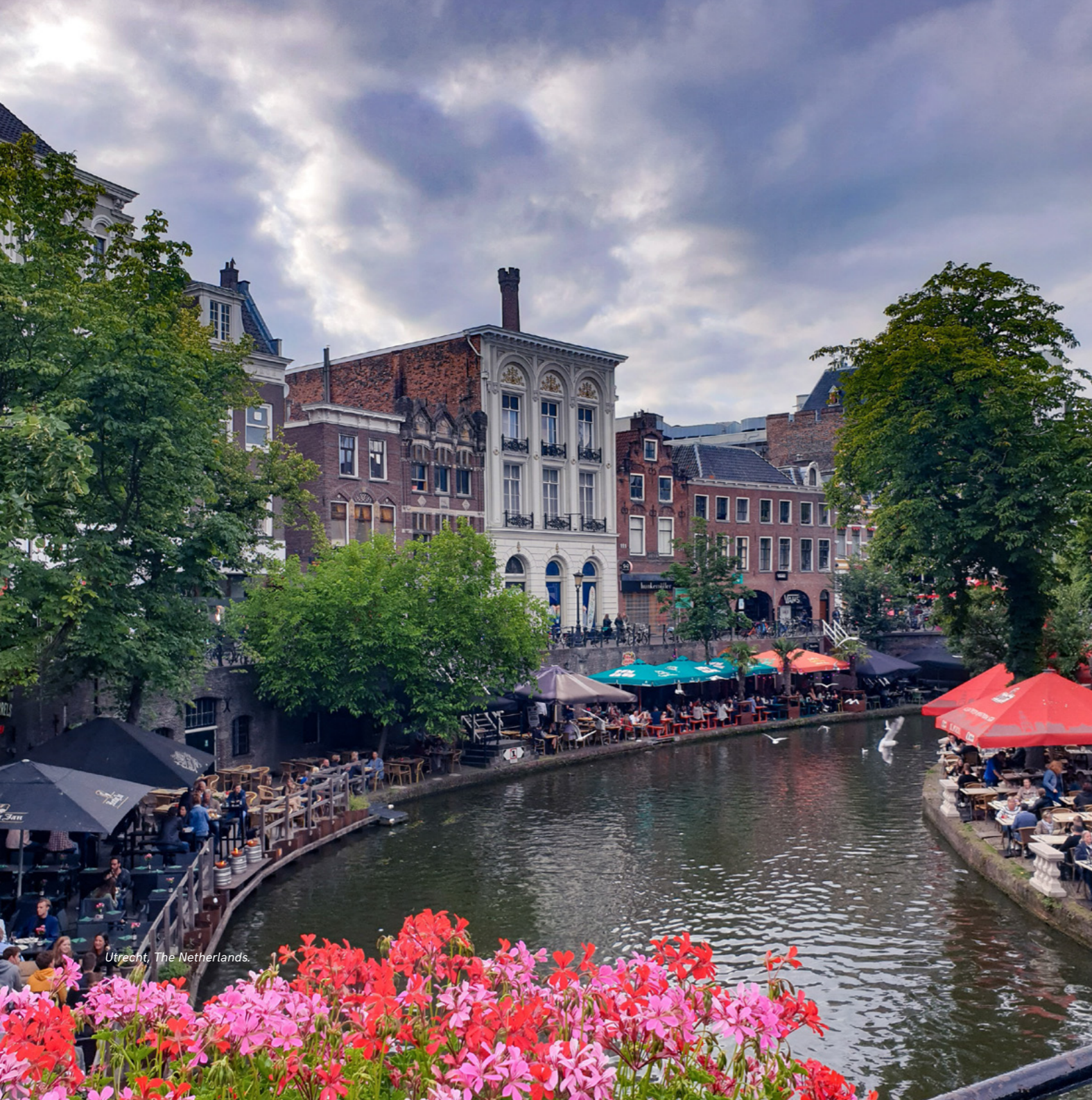
Utrecht, The Netherlands.