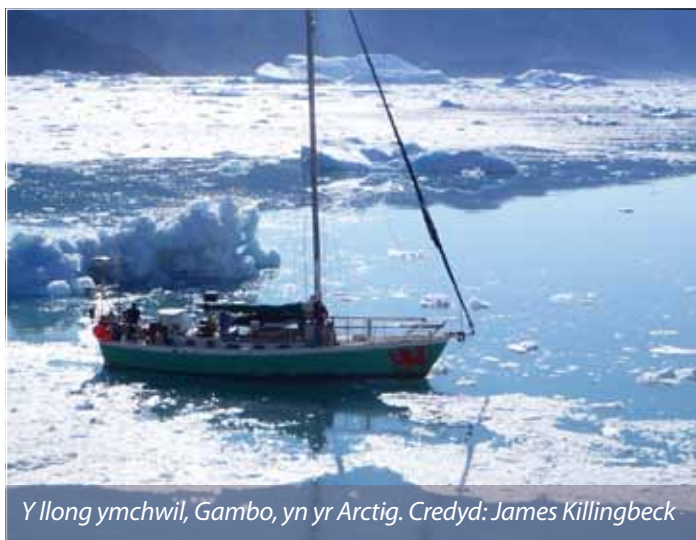
Y llong ymchwil, Gambo, yn yr Arctig.

Mae gwyddonwyr o Aberystwyth wedi bod yn rhan o daith arloesol i'r Arctig er mwyn ymchwilio i gylch bywyd mynyddoedd iâ.