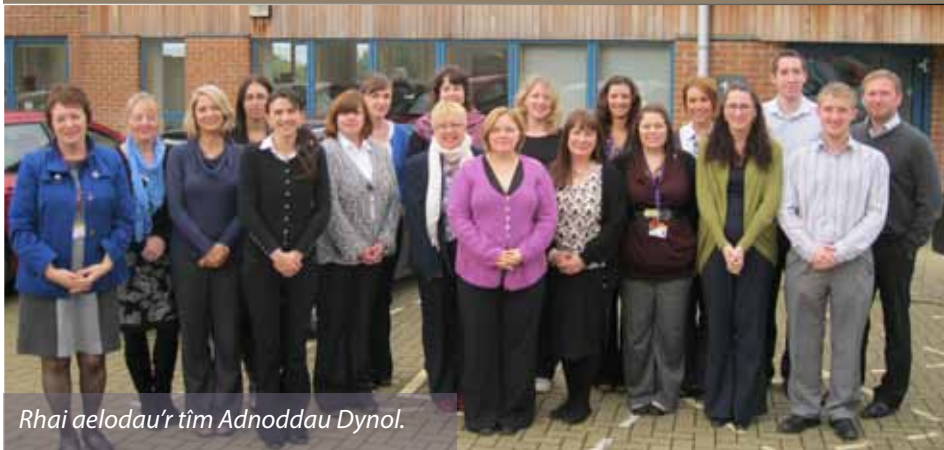
Rhai aelodau'r tîm Adnoddau Dynol.