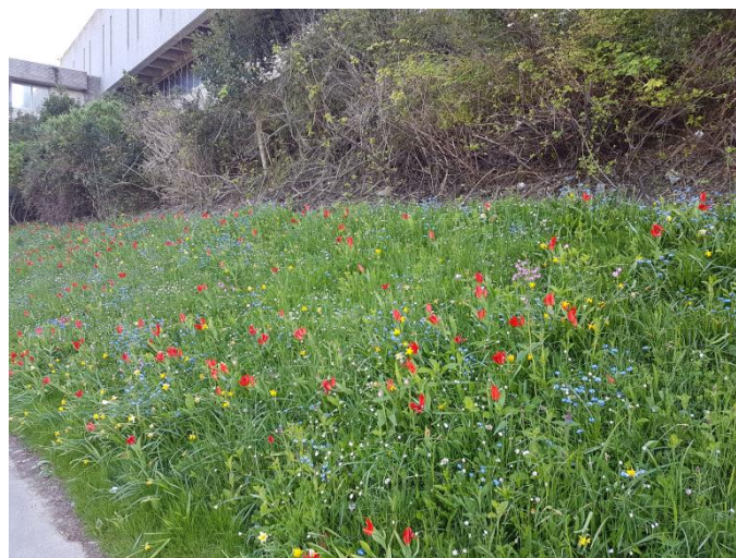
Ffigur 2 Enghraifft o ddôl blodau gwyllt sydd wedi'i chyflwyno ar Dir y Brifysgol

Mae ystyriaeth a chymeradwyaeth gan Gyngor y Brifysgol yn y pen draw i'r cynllun hwn a'i amcanion cysylltiedig yn dangos ymrwymiad y sefydliad ar lefel uwch i gyfoethogi a chadw bioamrywiaeth drwy ei weithredoedd.