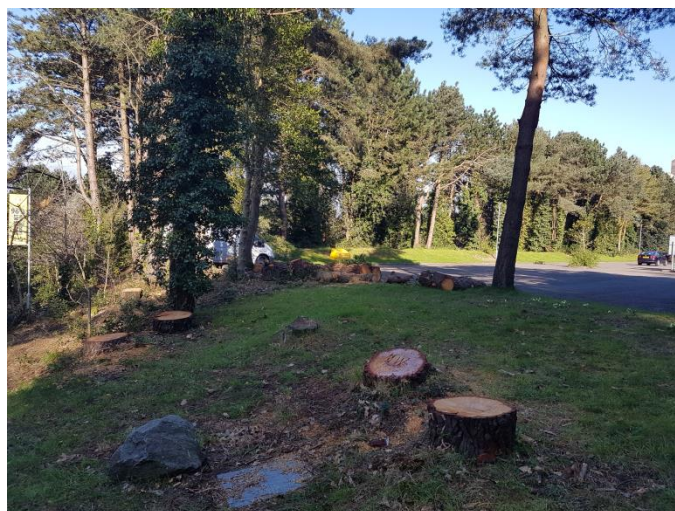
Ffigur 3 Enghraifft o bentryrau boncyffion a adawyd ar ôl gwaith ar y coed i hwyluso ac annog cynefinoedd pryfed