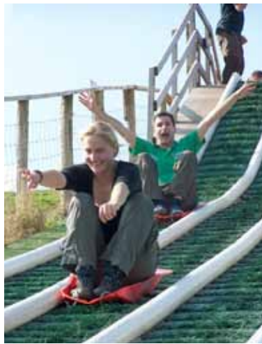
Samplo'r mega-lithren – y cyfan yn enw gwyddoniaeth, wrth gwrs.

Mae Prifysgol Aberystwyth wastad wedi cael dyfarniad uchel yn yr arolwg, ac roedd canlyniadau 2008 yn well nag erioed. Enillodd y cyrsiau gradd cefn gwlad, a redir yn IBERS, y marciau uchaf yn y DU i gyd. Ar gyfartaledd, gradd Bioleg IBERS a enillodd y sgôr uchaf o holl brifysgolion Cymru ac roedd eu sgoriau'n gyfartal â Cholegau Rhydychen, Caeredin, Bryste a'r Imperial.