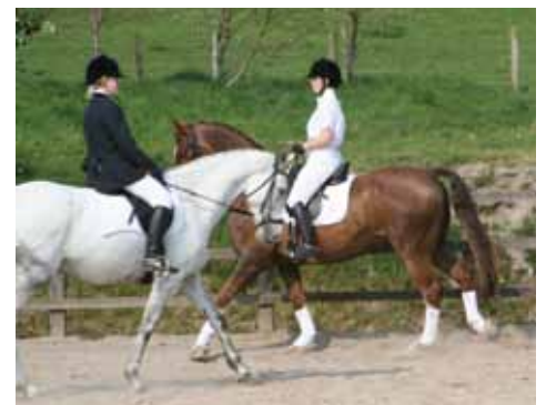
Myfyrwyr yn cynhesu yn arena allanol Lluest yn barod am eu cystadleuaeth dressage

Yn ogystal â'r digwyddiadau arbennig hyn roedd y cystadlaethau penwythnos arferol, sef neidio ceffylau a dressage, yn cael eu cynnal drwy gydol y gaeaf, a cawsant eu cefnogi crystal ag erioed.