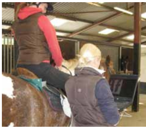
Downloading on to the computer the recording of the relative pressures placed on the horse's back by the rider and saddle, the pressure pad can be seen as the green mat under the back horse's saddle cloth

Adnabod brigau pwysau ar draws y cefn, gan ddefnyddio mat synhwyro pwysau. Adwaenir brigau pwysau yn y drefn glas golau (dwyster uchel); melyn, marŵn, glas tywyll (dwyster isel). Yn achos ceffyl a farchogir heb gyfrwy (A) fe ellir gweld ardaloedd o bwysau uchel iawn (glas golau), ynghyd ag ardal o bwysau uchel (melyn). Gyda chyfrwy, mae pwysau'n cael eu taenu'n fwy gwastad (B).