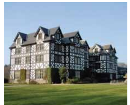
A luxury venue for the MSc Equine Science Colloquium