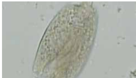
Ffotograff o Blepharocorys sp., sy'n nodweddiadol o'r math o ficro-organedd ciliedig a ddarganfyddir ym mherfeddion ebolion