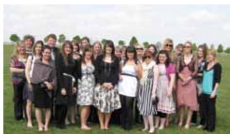
Pawb yn eu gwisgoedd gorau am y 2000 Guineas