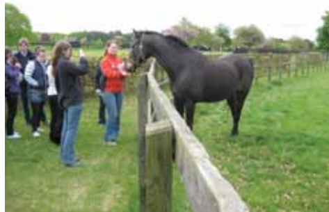
Rhoi 'polos' i Amberley House yn y National Stud